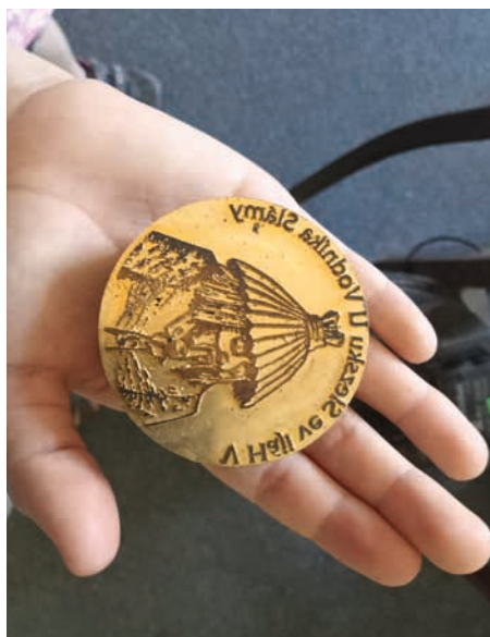
Matrice na výrobu Turistických známek se vyrábějí z kovu. Rozpálený kov zrcadlově vytvořený motiv do lipového dřeva vypálí a vznikne trvalý obrázek.

Mezi tisíce motivy najdeme kromě hradů, zámků a mnoha turisticky atraktivních lokalit také velké množství kostelů, kaplí, poutních míst, ale i křížových cest nebo kalvárií. Společnost Turistické známky v roce 2017 vydala sbírkovou známku na podporu vypáleného kostela Božího Těla v Gutech. Benefiční známka je aktuálně v prodeji i na pomoc válkou trpící Ukrajině. Sběratelské řady rozšiřují speciální edice vydávané k různým výročím, historickým událostem a sady známek podporují projekty turistických nebo poutních stezek. Nedávnou novinkou je QR kód s tzv. audiobedečkem, který dokáže prostřednictvím mobilní aplikace podat výklad. Ze všech známek, kterých je i s výročními a prémiovými vydáno 5 766, jich má audiobedeček již 3 000.