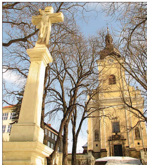
Farní kostel v Napajedlech