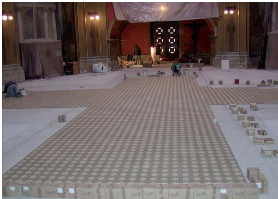
Rekonstrukce podlahy v bazilice na Svatém Hostýně