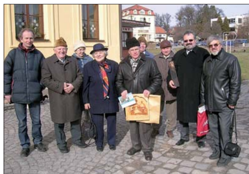
Zástupci Matice radhoštské s předsedou Matice svatohostýnské

„Velký dějinný zlom, který je spjat s příchodem sv. Cyrila a Metoděje, je právě v tom, že zde zahájili tento životní způsob. Vytvořili zde křesťanskou společnost. Ta se projevila svou svébytnou kulturou, které dali do vínku možnost písemného záznamu vlastní tradice. A tato společnost nad sebou vyzvedla i právní systém státu. Naše křesťanství, kulturnost a státnost je nedělitelným odkazem sv. Cyrila a Metoděje.“