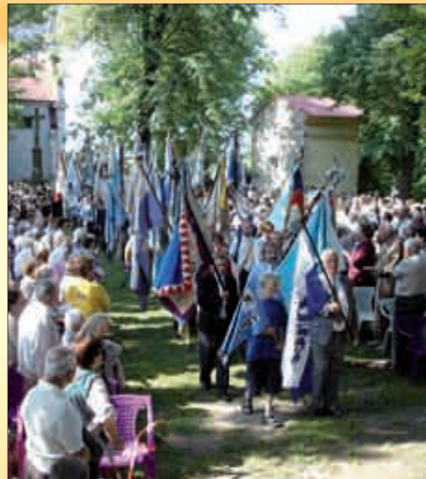
Tradiční orelská pouť