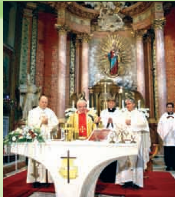
Pouť Radia Proglas a Televize Noe