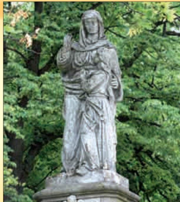
Socha sv. Anny