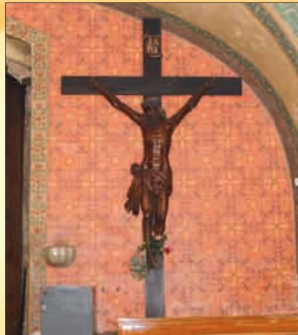
Památný kříž u hlavního vchodu