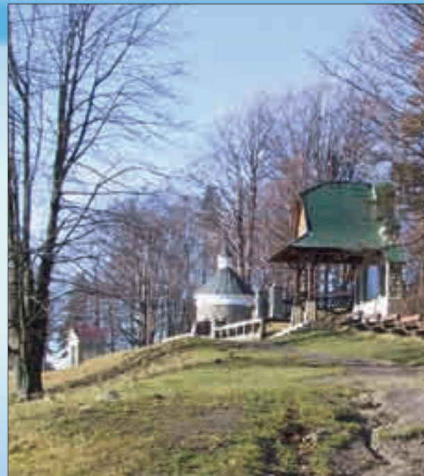
Předjaří na Svatém Hostýně