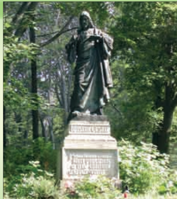
Socha Božského Srdce Páně