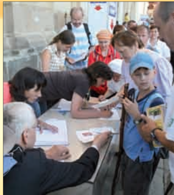
Poutní cesta Velehrad – Svatý Hostýn