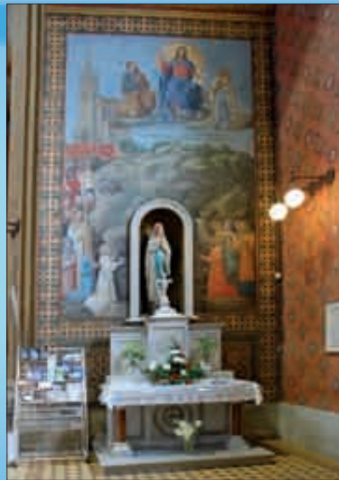
Oltář Panny Marie Lurdské