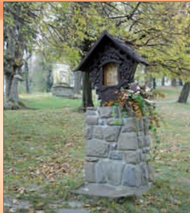
Památník s obrazem sv. Huberta