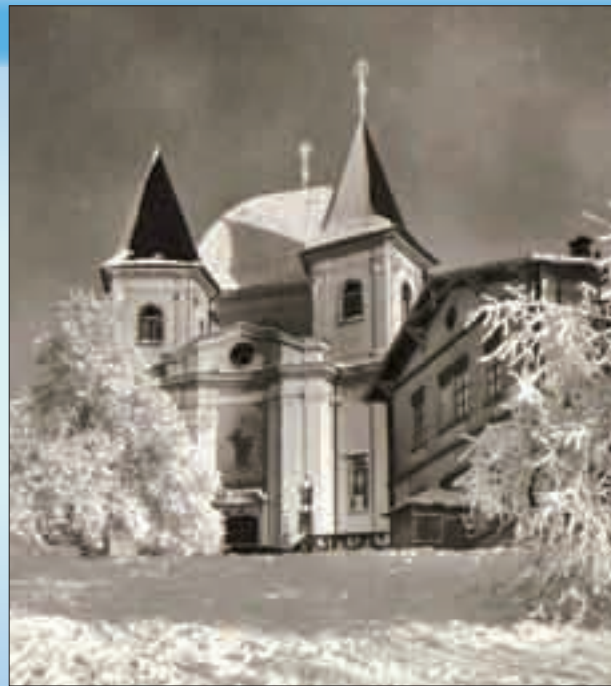
Zima na Svatém Hostýně ve 20. letech minulého století