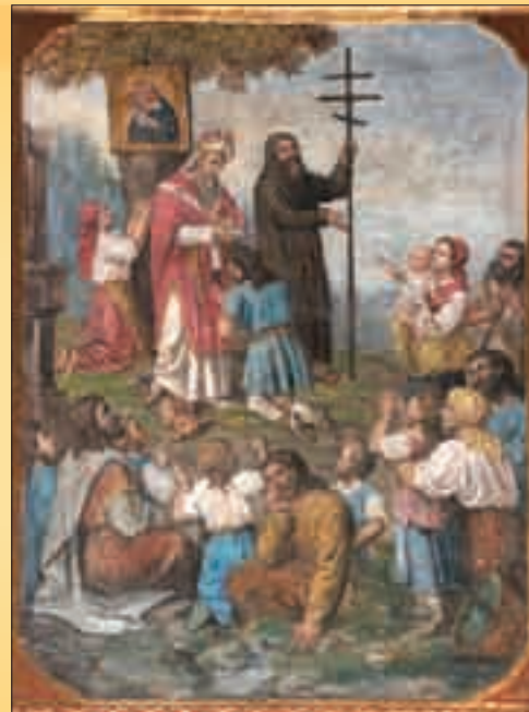
Nástěnný obraz v bazilice Sv. Cyril a Metoděj přinášejí víru na Velkou Moravu