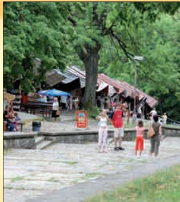
Poutní krámky patří ke koloritu Svatého Hostýna