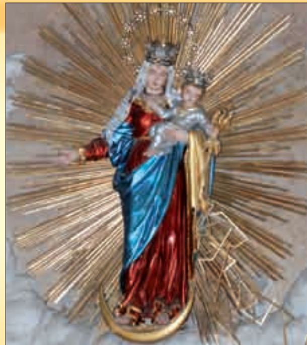
Socha Panny Marie Svatohostýnské