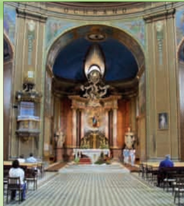
Pohled do chrámové lodi