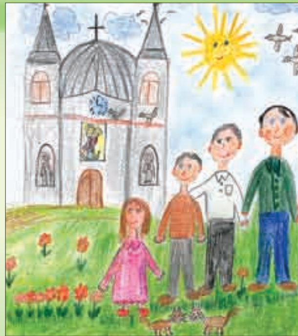
Svatý Hostýn očima devítileté Kláry