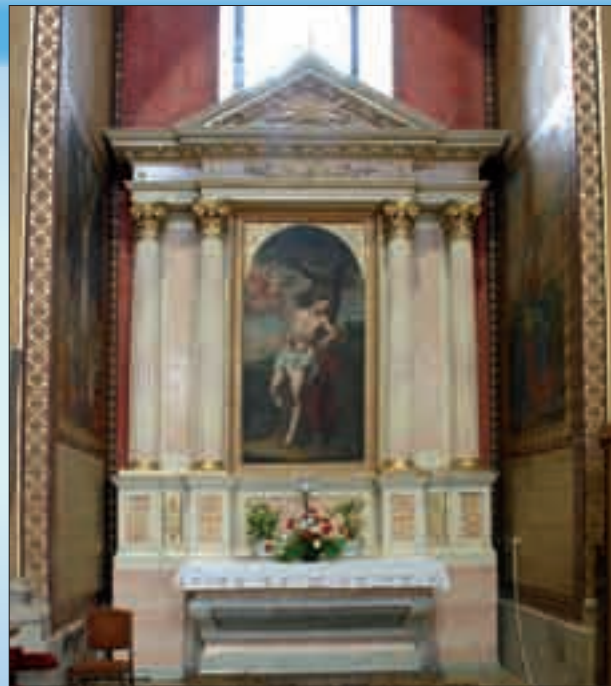
Oltářní obraz Umučení sv. Šebestiána