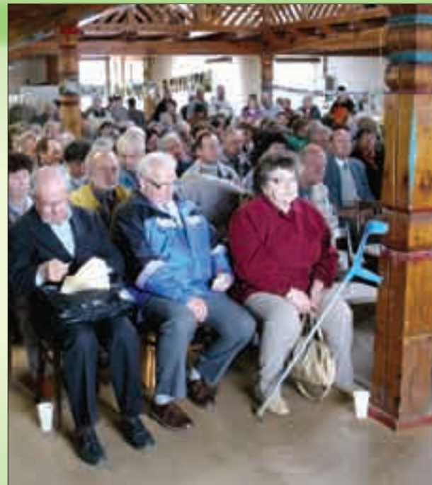
Valná hromada Matice svatohostýnské