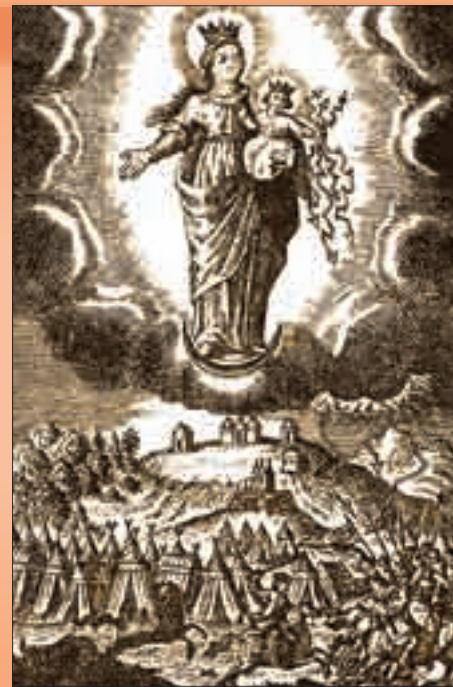
Obrázek Panny Marie Svatohostýnské (1723)