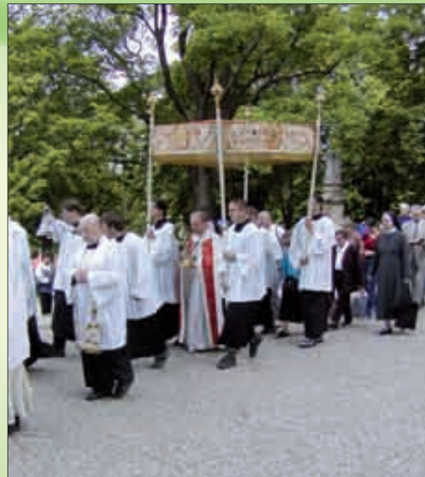
Eucharistický průvod z Bystřice pod Hostýnem na Svatý Hostýn