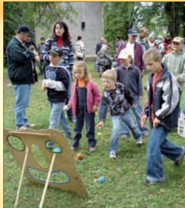
Dětská pouť na konci prázdnin