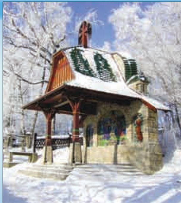
Jurkovičova křížová cesta