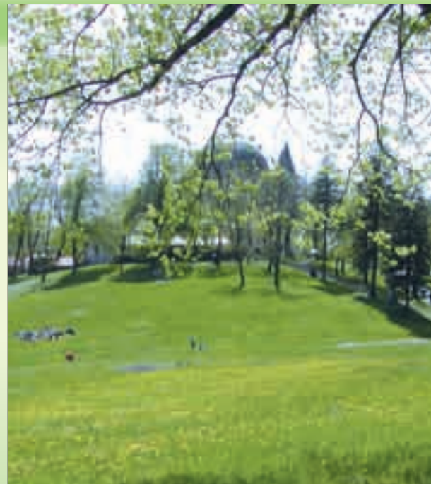
Jaro na Svatém Hostýně