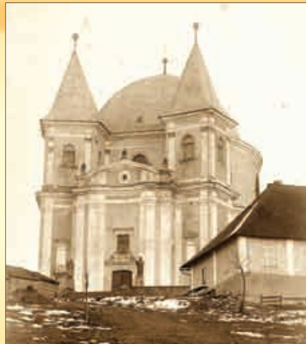
Pohled na hostýnský chrám v roce 1892 (bez mozaiky a schodiště)