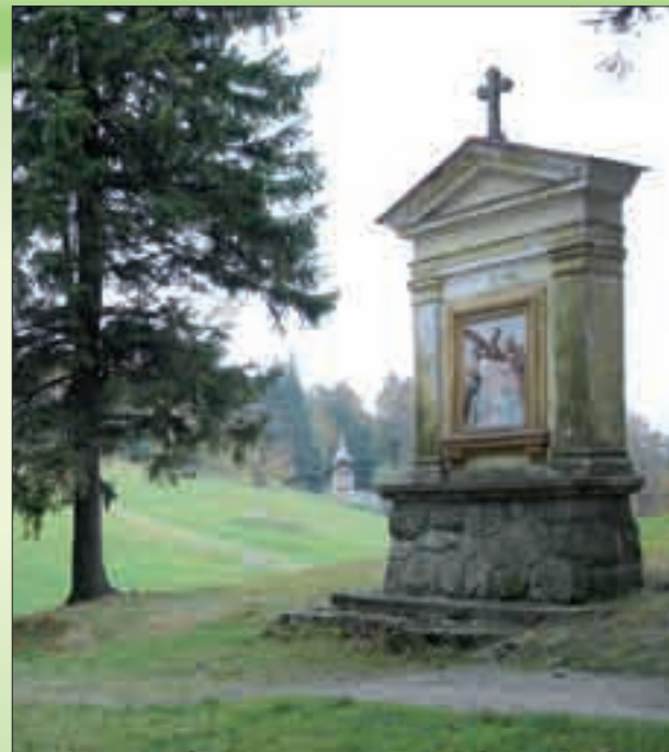
Stará křížová cesta