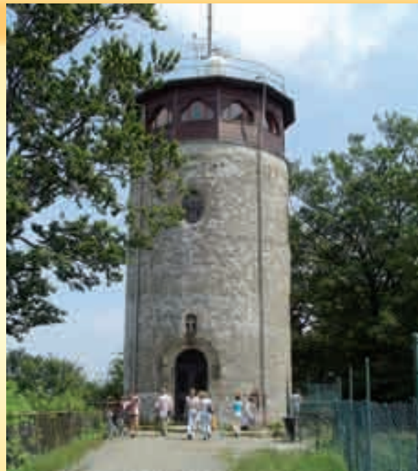
Rozhledna na Svatém Hostýně