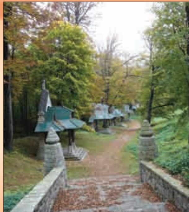
Jurkovičova křížová cesta