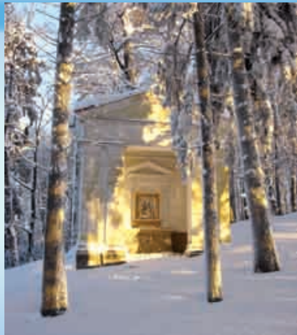
Stará křížová cesta