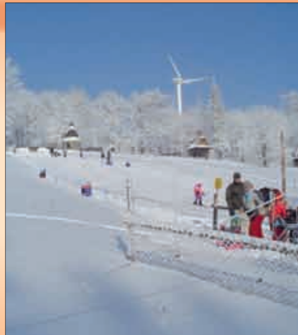
Lyžařský vlek na Svatém Hostýně