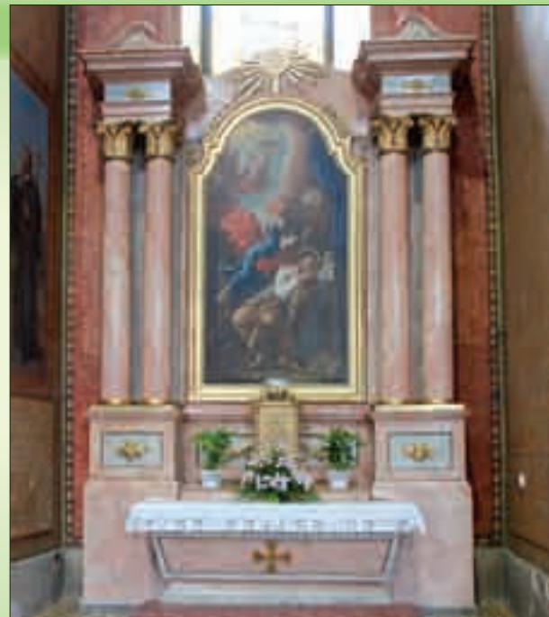
Oltářní obraz Sen sv. Josefa