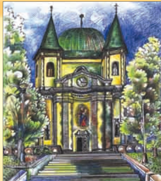
Svatý Hostýn očima čtrnáctileté Mirky