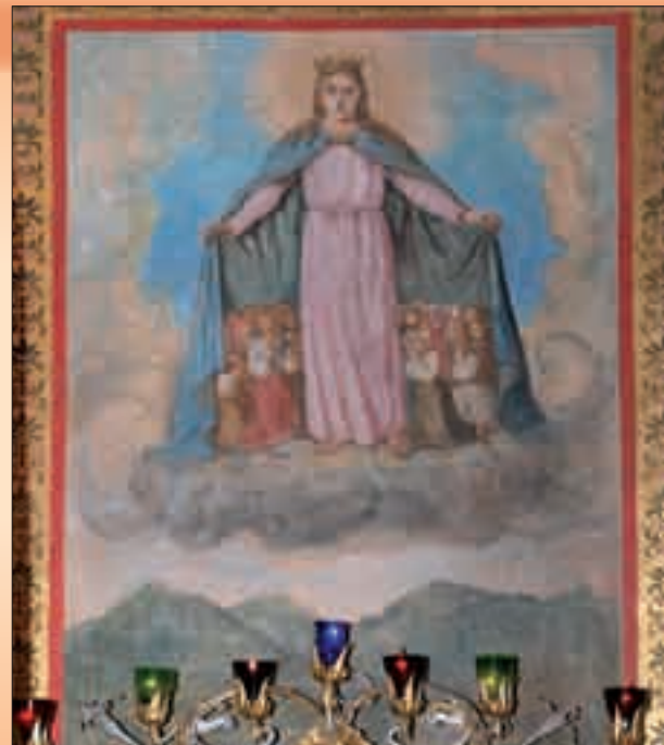
V bazilice je nejstarší známé vyobrazení Panny Marie Ochránitelky