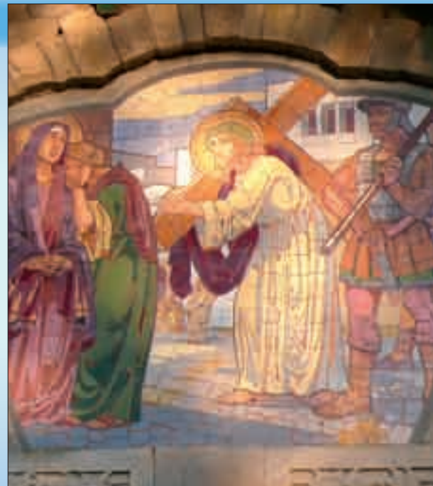
Detail mozaiky Jurkovičovy křížové cesty