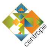
Slovensky dom Centrope